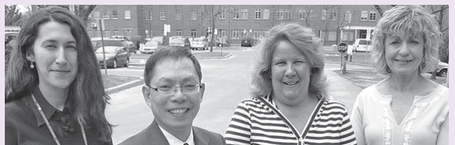
Les lauréats des premiers prix d'excellence en travail social de CAMH célèbrent leur nomination.

Afin de souligner le travail exceptionnel de quatre membres de son personnel, CAMH a révélé l'identité des gagnants des tout premiers prix d'excellence en travail social, le 4 mars dernier, à l'occasion de la semaine du travail social.