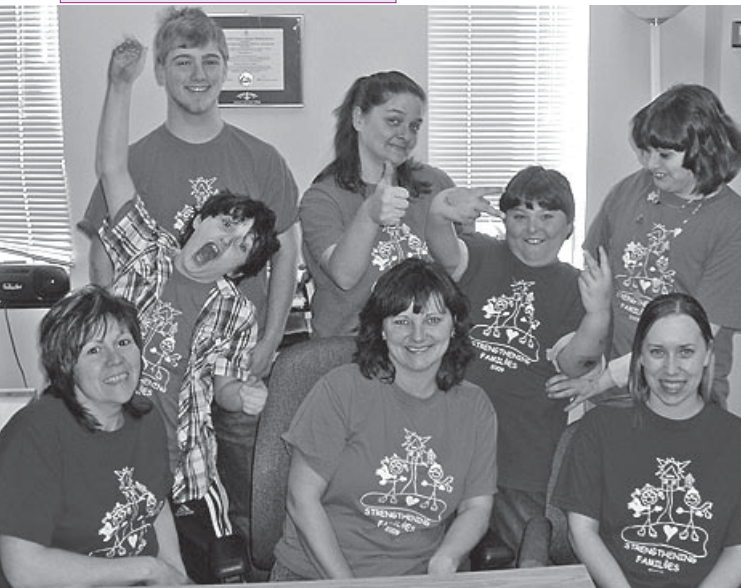
Les coordonnateurs et les participants travaillent ensemble pour renforcer les liens familiaux.

provinciaux de CAMH, Nord de l'Ontario. M me Ott ajoute que le programme a fait l'objet d'un grand soutien à Sault Ste. Marie. Les directeurs d'école ont aidé à l'identification des familles à risque et des jeunes qui pouvaient éviter une exclusion temporaire en participant au programme à titre de « mentors ».