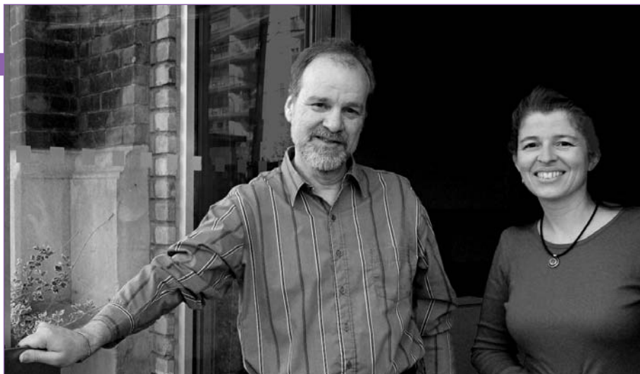
Le personnel du Centre R. Samuel McLaughlin de renseignements sur la toxicomanie et la santé mentale offre de l’information en personne, par téléphone ou en ligne.