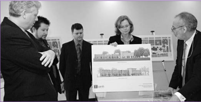
Le maire de Toronto, David Miller, examine un plan du nouvel emplacement de CAMH en compagnie du p.-d.g. de CAMH, Paul Garfinkel.

Féru d'urbanisme depuis longtemps, le maire s'est montré enthousiaste à l'égard des nouveaux parcs et de la manière dont le site s'intègre au reste du quartier. L'aménagement de magasins, de galeries d'art et de cafés contribuera aussi à la revitalisation du quartier de la rue Queen Ouest.