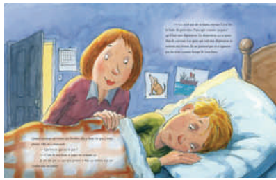
Deux pages du livre